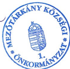
Tóthné Szabó Anita polgármester